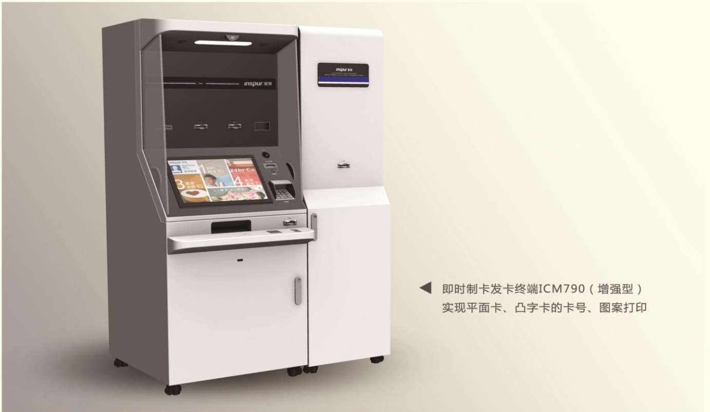
◀ 即时制卡发卡终端ICM790（增强型） 实现平面卡、凸字卡的卡号、图案打印