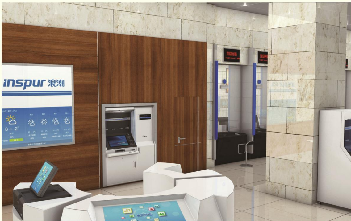
▲ 即时制卡发卡终端ICM790（增强型）穿墙应用效果图