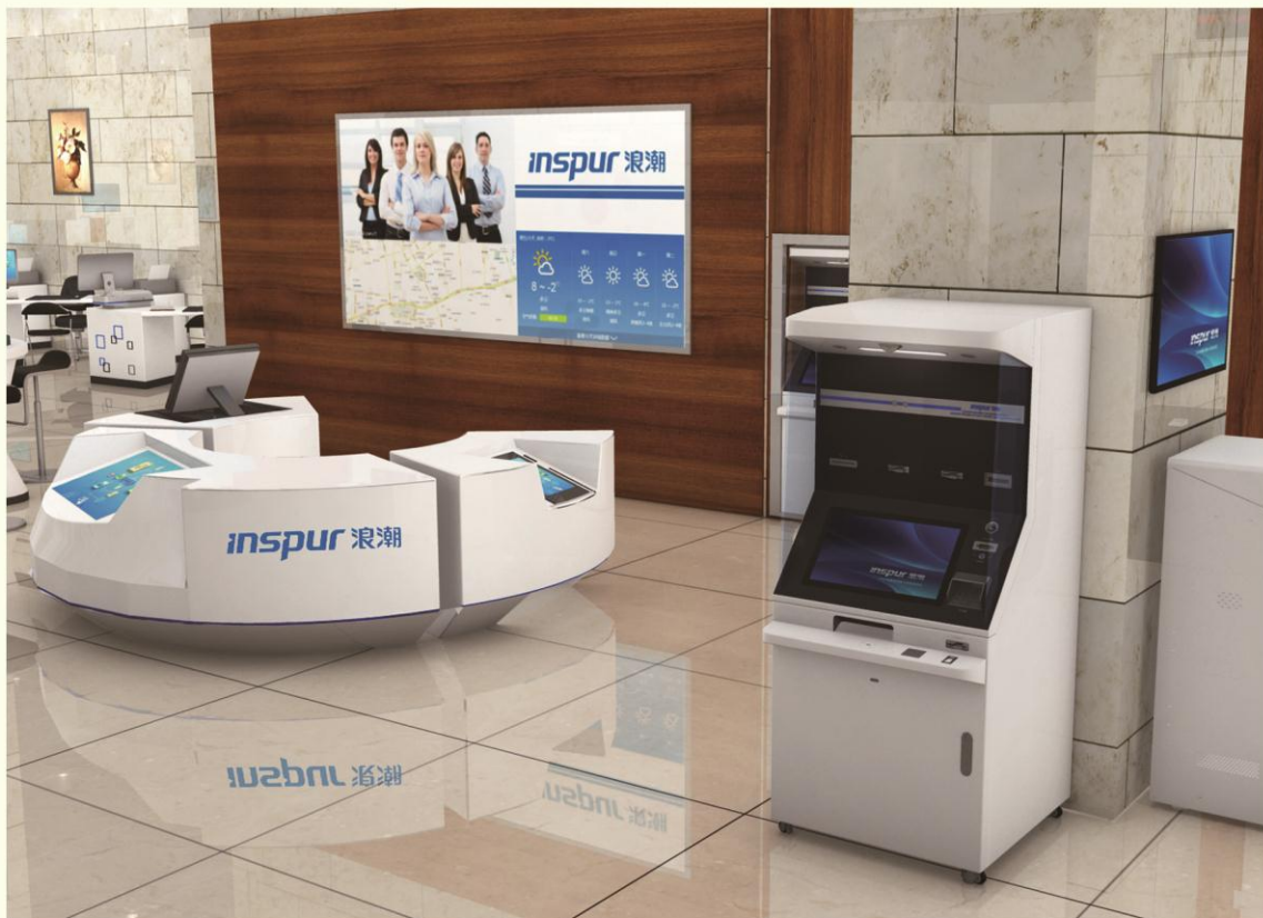
▲ 即时制卡发卡终端ICM760（标准型）大堂应用效果图