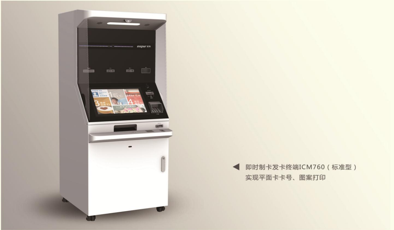
◀ 即时制卡发卡终端ICM760（标准型） 实现平面卡卡号、图案打印